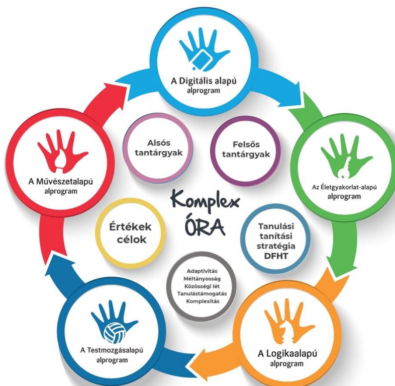
A Komplex órák felépítése